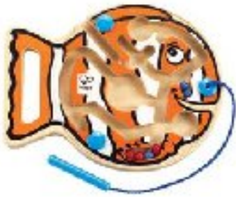
Hape Wooden Maze CAD 20.00