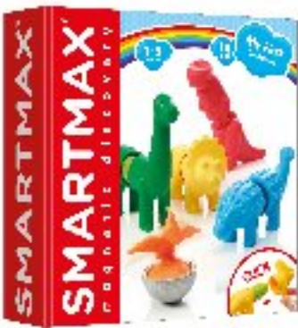
Smartmax Dinos CAD 40.00