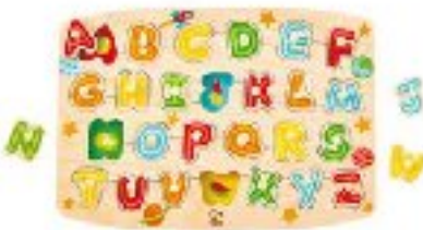
Hape Alphabet Peg Puzzle CAD 20.00