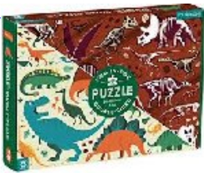
2 in 1 Dino Puzzle CAD 25.00