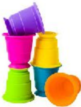
Suction Kupz CAD 22.00