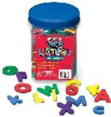
Foam Magnetic Letters CAD 32.00