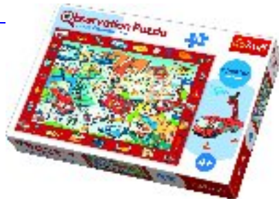
I Spy Observation Puzzles CAD 22.00