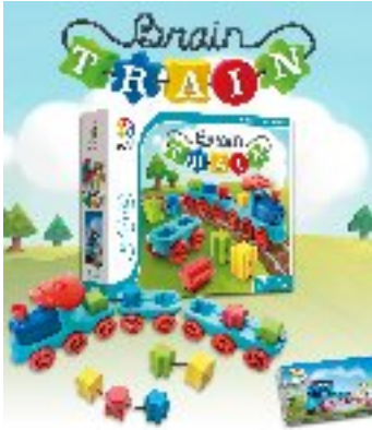
Braintrain CAD 46.00