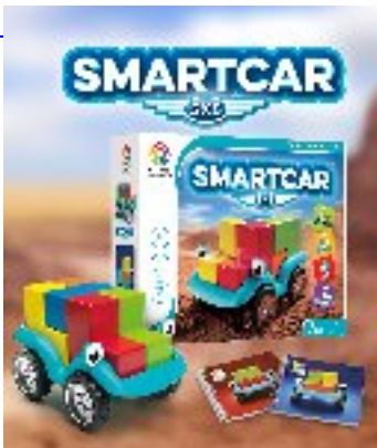
Smartcar CAD 46.00